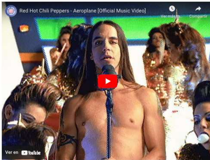
AEROPLANE DEL DISCO ONE HOT MINUTE

En 1995, la formación Kiedis-Flea-Smith-Navarro lanzó el álbum que repartió opiniones entre sus fans y originó algunos murmullos de la crítica: One Hot Minute .