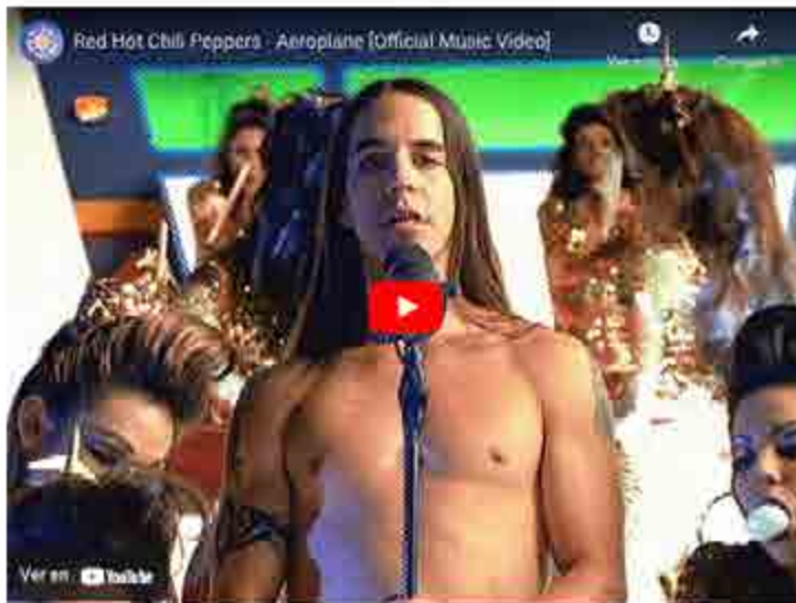
AEROPLANE DEL DISCO ONE HOT MINUTE

En 1995, la formación Kiedis-Flea-Smith-Navarro lanzó el álbum que repartió opiniones entre sus fans y originó algunos muturros de la crítica: One Hot Minute .